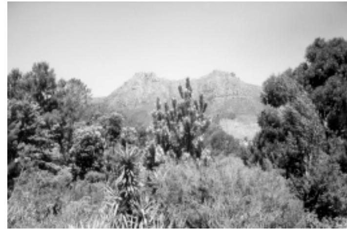
Der den Ritualplatz umgebende Garten mit Blick auf die Berge