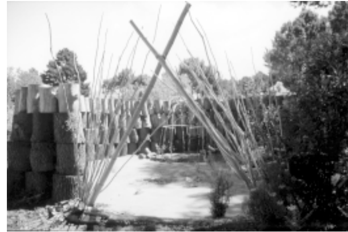
Der Eingang und die Schwelle zum Ritualplatz

Der Abend diente der Verabschiedung des Alten. Ich hatte in meiner Vorbereitungszeit drei unterschiedliche Themenkomplexe auf Papier geschrieben und gemalt. Wir überlegten nun, ob ich alle Zettel zusammen im Feuer verbrennen und dann anschließend in die Schwitzhütte gehen sollte oder ob es sinnvoller sei, jedes Thema einzeln zu verabschieden und damit auch drei Schwitzprozesse zu durchlaufen. Ich wählte das zweite Vorgehen, weil ich mich ganz bewusst von jedem Thema einzeln trennen und auch spüren wollte, wie sich dieser Prozess anfühlte. Dafür war es auch bedeutsam, festzulegen, in welcher Reihen-