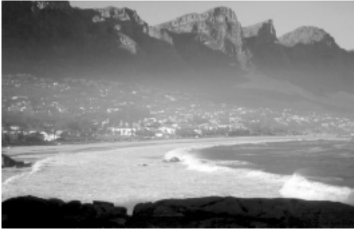
Camps Bay von den 12 Aposteln (Berge) umrahmt

Das Ritual sollte abends beginnen, die Nacht mit einschließen und am folgenden Morgen beendet werden. Als Einstimmung saß ich gegen 18 Uhr ungefähr eine halbe Stunde am Strand von Camps Bay und schaute auf das Meer.